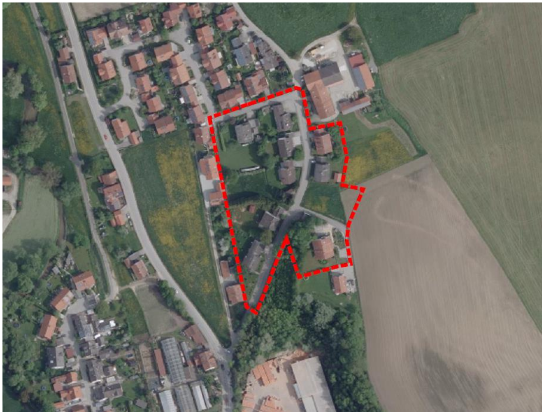
Abb. 4 Plangebiet, ohne Maßstab, © Bayerische Vermessungsverwaltung, Stand 2018

Westlich der Feldstraße fällt das Gelände stark ab, östlich der Feldstraße steigt es nach Süden hin, sodass die Gebäude auf den Fl.Nrn. 575/1 und 575/3 auf dem höchsten Punkt des Hügels liegen. Angrenzend an das Plangebiet befinden sich im Westen und Nordwesten Wohngebäude, östlich und nordöstlich bestehen landwirtschaftliche Nutzflächen. In etwa 180 m Entfernung befindet sich ein Gewerbegebiet, das durch dichten Baumbewuchs vom Plangebiet getrennt ist.