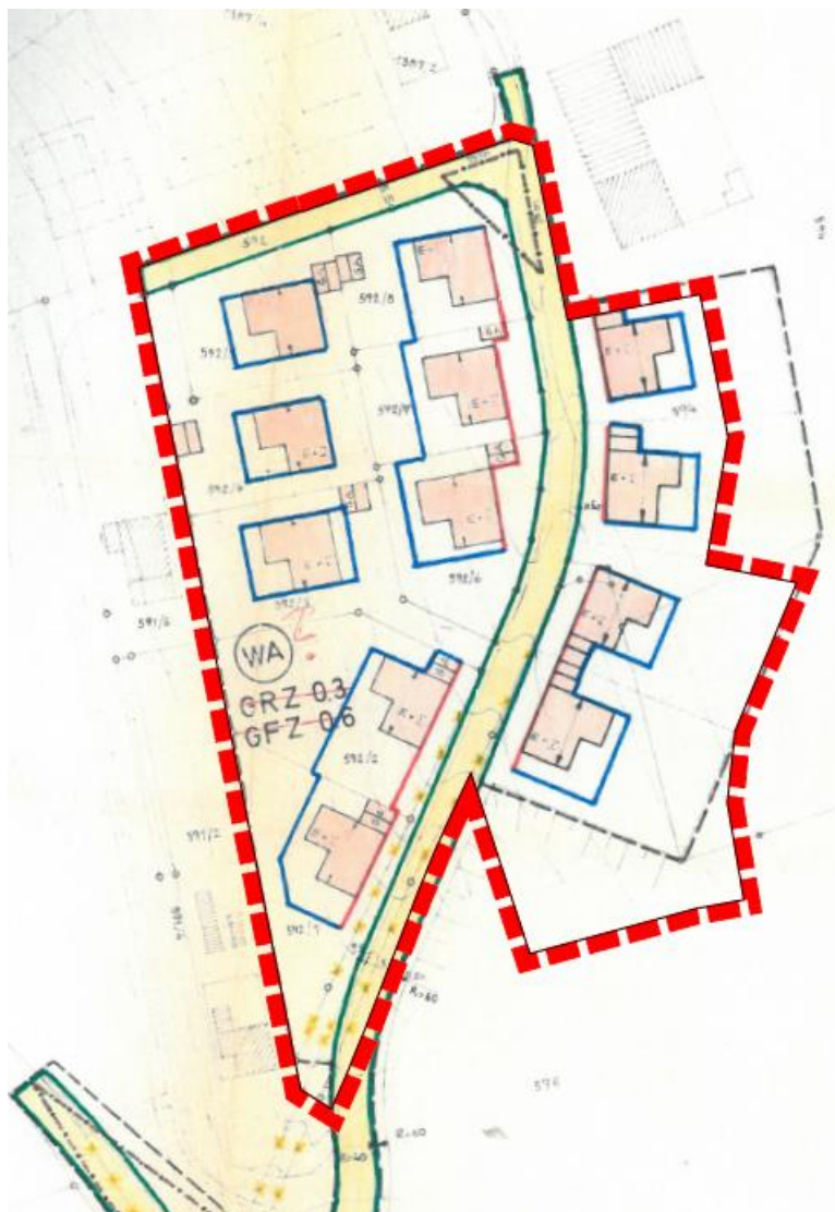
Abb. 2 Ausschnitt aus der Planzeichnung des Bebauungsplans „Isen Nord“ i.d.F. vom 27.09.1973 mit Geltungsbereich der 2. Änderung, ohne Maßstab

Die 1. rechtskräftige Änderung des Bebauungsplans in der Fassung vom 06.10.1992 umfasst dessen südöstlichen Teilbereich und erweitert den Geltungsbereich nach Süden. Innerhalb des Geltungsbereichs der 1. Änderung werden eine talseitige Wandhöhe von 7,5 m sowie eine Dachneigung von 22° bis 35° festgesetzt und die Beschränkung auf Einzelhäuser aufgehoben. Darüber hinaus wurden die Festsetzungen des rechtskräftigen Bebauungsplans nicht geändert.