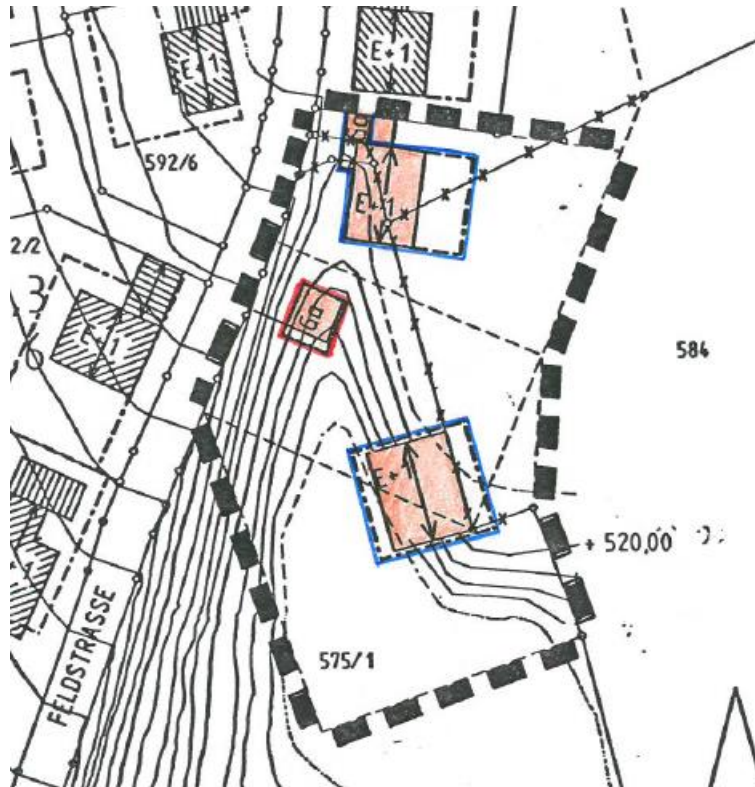
Abb. 3 Planzeichnung der 1. rechtskräftigen Änderung des Bebauungsplans „Isen Nord“ i.d.F. vom 06.10.1992, ohne Maßstab