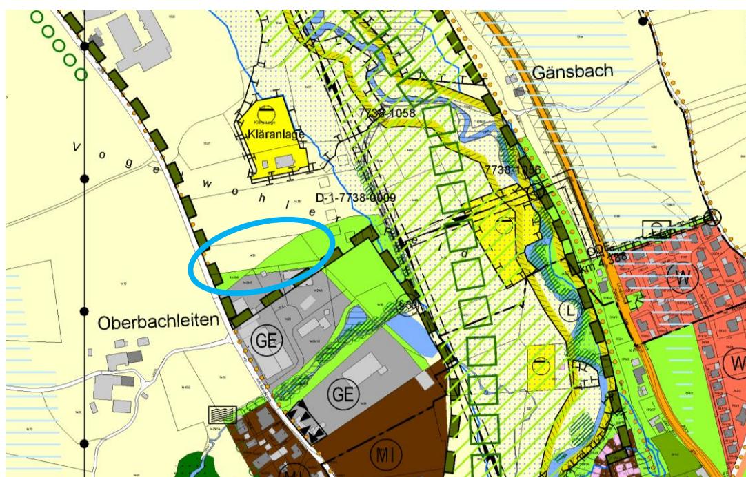
Abb.: Ausschnitt aus dem rechtswirksamen Flächennutzungsplan des Marktes Isen (digitalisierter Stand vom 17.12.2019), ohne Maßstab, mit blauer Umrandung des Plangebietes