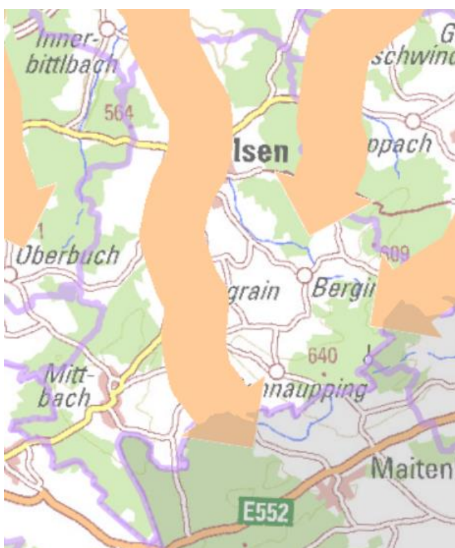
Ausschnitt aus dem Regionalplan mit dem Marktgemeindegebiet Isen und dem Regionalen Biotopverbund entlang der Isen (Pfeil in apricot)

1.3.3 (Z) Der regionale Biotopverbund ist durch Siedlungsvorhaben und größere Infrastrukturmaßnahmen nicht zu unterbrechen, außer durch Planungen und Maßnahmen im Einzelfall, sofern sie nicht zu einer Isolierung bzw. Abriegelung wichtiger Kernlebensräume führen und der Artenaustausch ermöglicht bleibt.